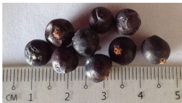
Rajah 1 Buah atau beri juniper yang boleh diperolehi dari pasaran tempatan.

Keluarga tumbuhan Cupressaceae (atau Cypress) hanya terdiri daripada 30 genera, 134 spesis, 7 subspecies, 38 variasi dan satu jenis tumbuhan, berjumlah 180 taksa yang dikenali (Schulz et al., 2005). Keluarga ini termasuklah genus Juniperus , iaitu satu genus utama yang mengandungi lebih kurang 70 spesis pokok (Karapandzova et al., 2014). Kunci pengenalan pokok ini bergantung kepada ciri-ciri daun matang dan kon buah betina. Herba ini diguna secara meluas di Eropah, sebagai agen penambah perisa masakan. Kedua-dua pohon jantan dan betina diperlukan untuk menghasilkan buah atau beri juniper (Owen, 2016). Beri hijau yang putik akan masak dan bertukar warna menjadi gelap dan kebiru-biruan (Rajah 1). Sampel pokok Juniperus juga boleh disaksikan oleh pengunjung Taman Eropah di Putrajaya (KOSMO! Online).